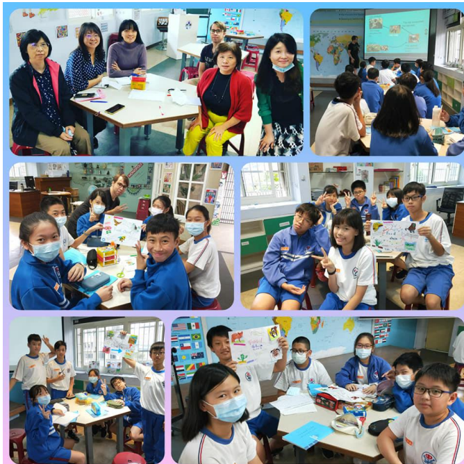
Co-teachers' meeting 教師共備和食物鏈課程。