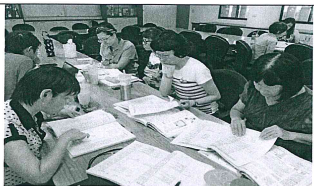
說明：歷史組專業對話