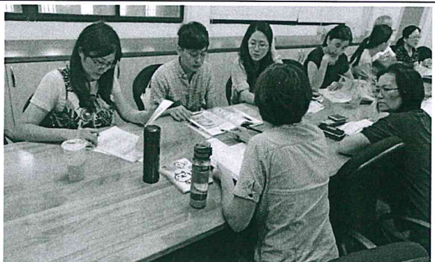
說明：地理組專業對話