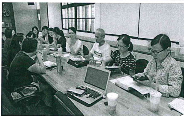
說明：公民組專業對話