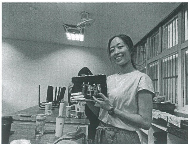
雙語課程問答技巧