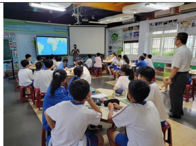
1 South Africa 外師簡介他的國家——南非。