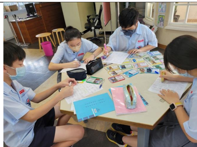
3 Animal Attributes I 學生透過色彩豐富並具有每個動物基本屬性的遊戲卡片，讓學生先熟悉動物的名字。