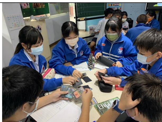
6 Landforms I 透過關於地形的遊戲卡片和學習單，讓學生熟悉各式的地形。