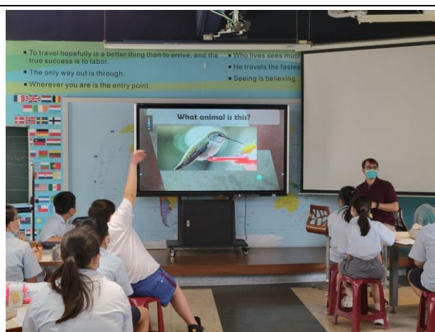
2 Animals and their Habitats 透過單字遊戲、配對和學習單的完成，學生學習一些動物和他們的棲息地。