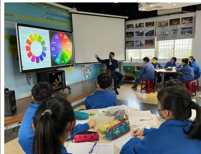
Secondary and tertiary colors 介紹次原色及三次色