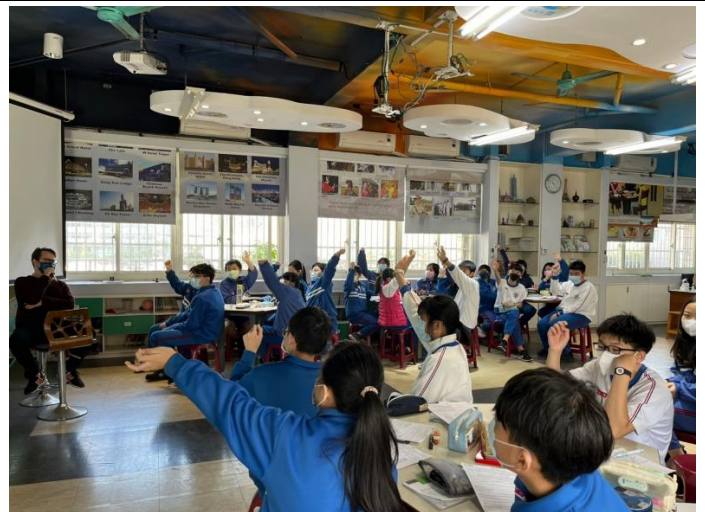
Vocabulary activities 相關單字活動