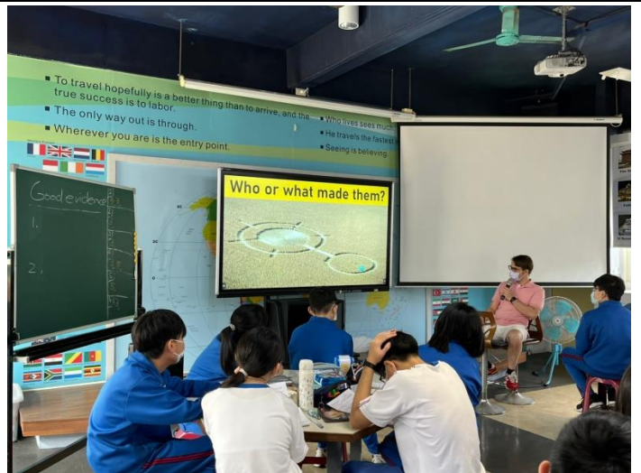
Paranormal Series: Crop Circle 介紹世界之謎：麥田圈