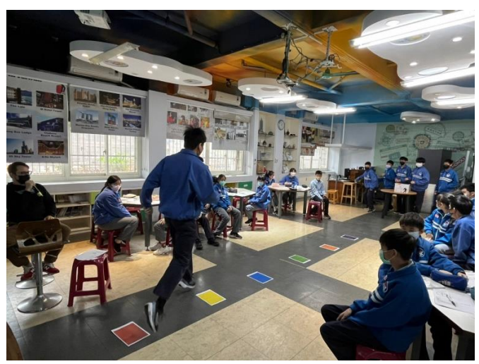
The color bridge 三原色的延伸活動：彩虹橋。