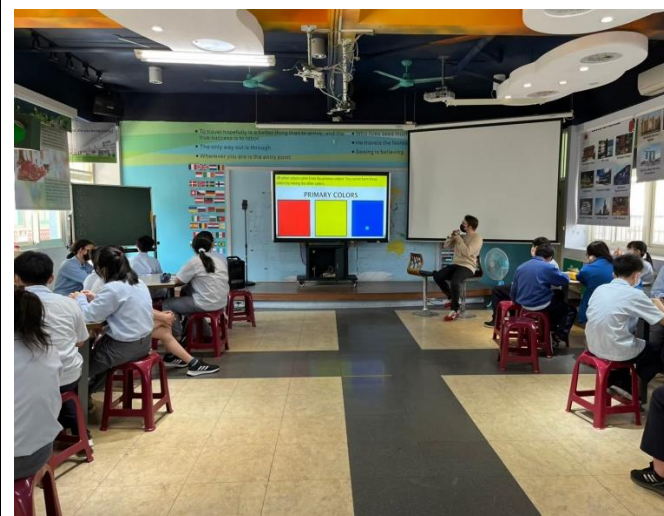
Primary colors 介紹三原色及其特性。

這學期第一段考前的主題以美術為主：先介紹三原色、二次色及三次色，再將所學應用於畫作欣賞。透過單字活動、延伸活動及學習單，建立學生對色彩的敏銳度之外，也提升學生的英文能力。