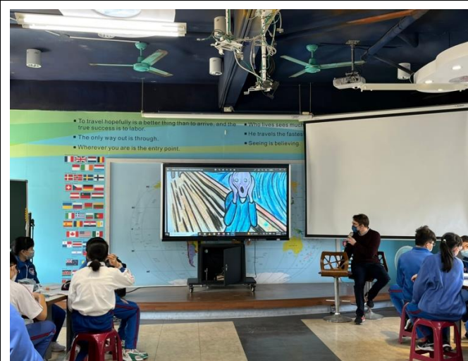
The scream 畫作欣賞：吶喊