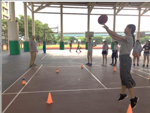
8. 找方位競賽 Direction Competition