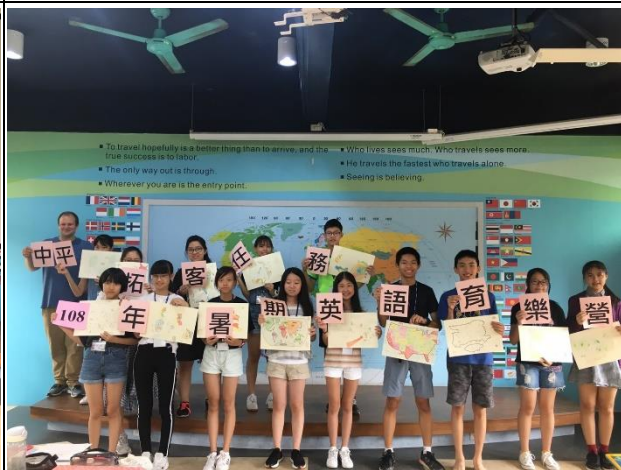
12. 大合照 Group Picture