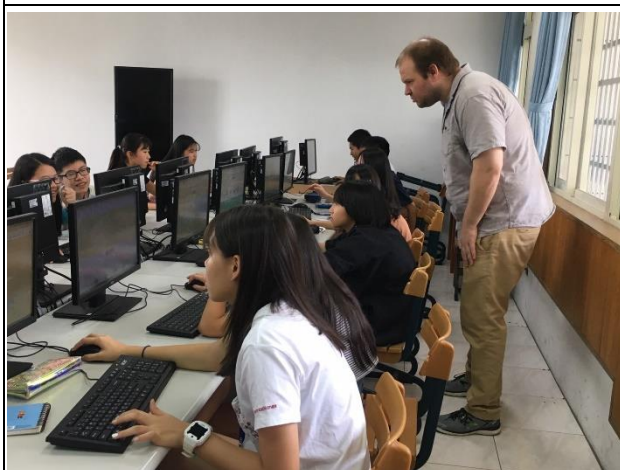
5. 蒐集資料 Data Collection