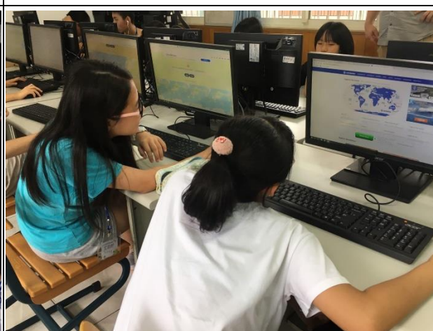
4. TerraClues 應用 TerraClues Application