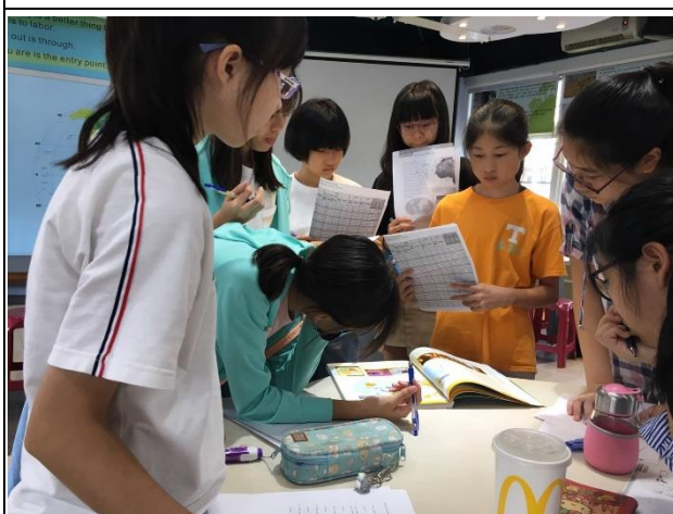
3. 世界地圖冊問答集 World Atlas Map Q & A