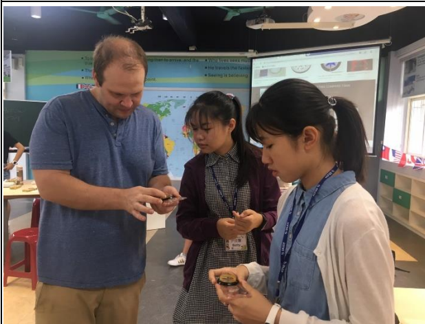
9. 持羅盤找方位 Location Finding