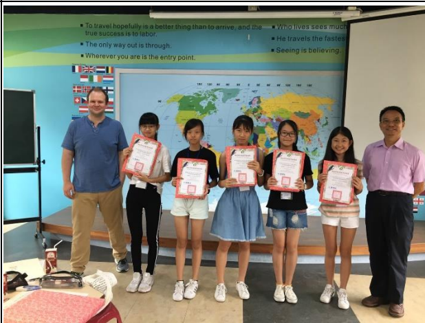
11. 頒獎 Closing ceremony