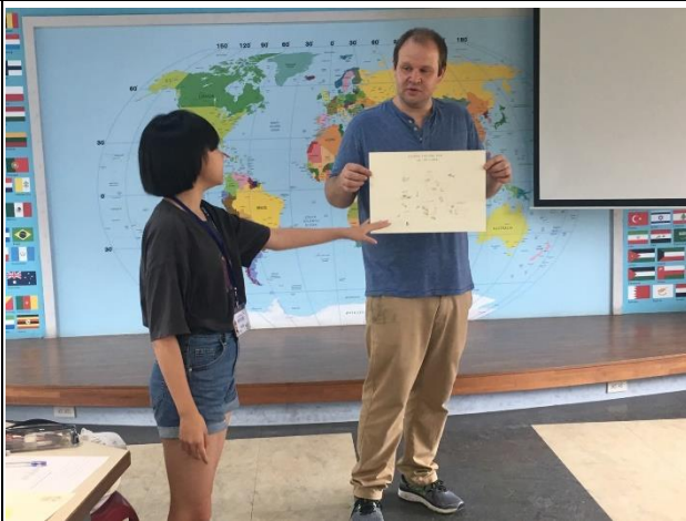
7. 口頭報告 Presentation