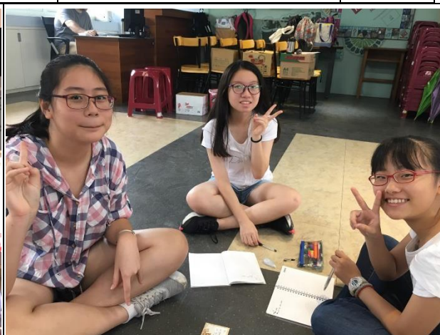
2. 小組討論 Group Discussion