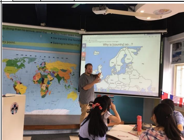
1. 教師授課 Lectures