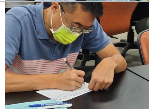
認真完成給寶貝的話