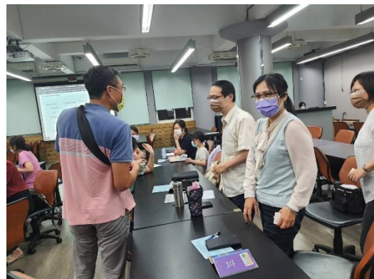
來不及抄就趕快照下來，分享彼此育兒經