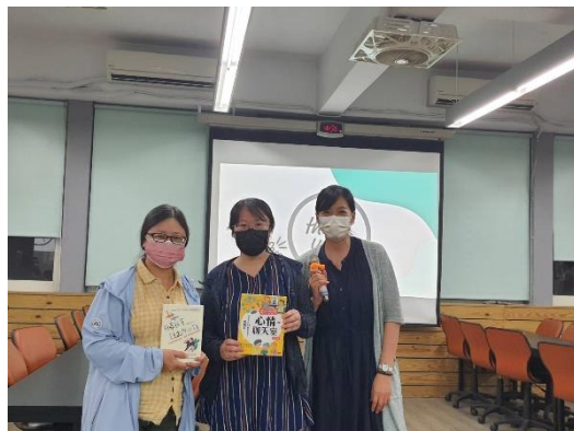
與講師互動，小志工也一起加入，贈書及致贈感謝狀