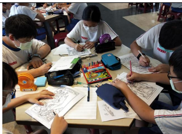
學生認真學習新藝術繪畫