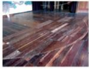
圖 1-9-10 旋轉舞臺。 位在本舞臺上，是重要的換景設備。

*源於17世紀，合音樂、舞蹈、表演技巧於一身。 *純男性演員演出、佈景精緻、舞台機關複雜、 服裝華麗、及妝容。 *「黑衣」換景、處理道具、提詞...等。