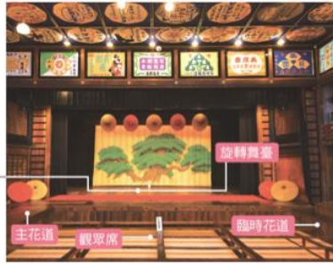
圖 1-9-11 歌舞伎舞臺空間 布置圖，舞臺上方的橫梁和 天花板上貼滿廣告。