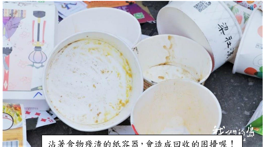
沾著食物殘渣的紙容器，會造成回收的困擾喔！

環保署要在 2025 年全面限塑，限制塑膠購物袋、免洗餐具、一次性外帶飲料杯和塑膠吸管，到了 2030 年，達到全面禁塑的目標。到那時候，就不會有難搞的含塑紙容器了吧！但是，在那之前，請大家好好地把紙容器與一般紙類區分清楚，吃喝完了，還請把紙杯紙盒清洗乾淨再回收吧！