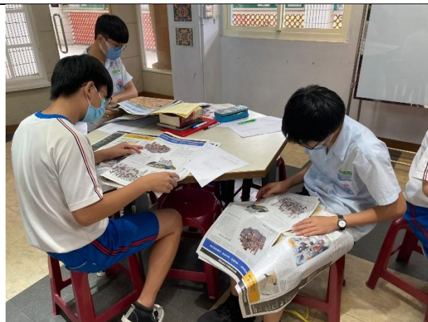
進行各版圖文閱讀