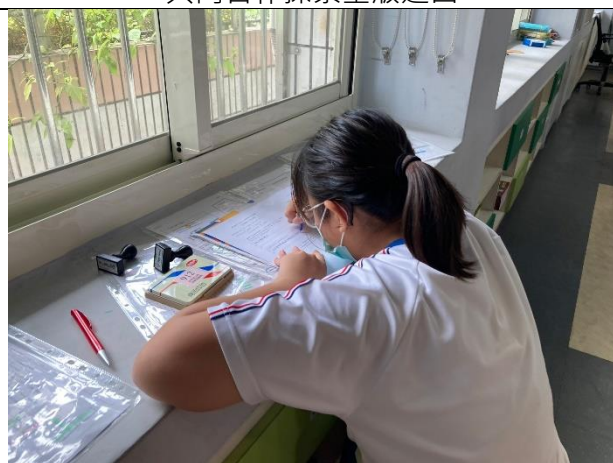
「報紙是一扇觀看世界的窗口。」