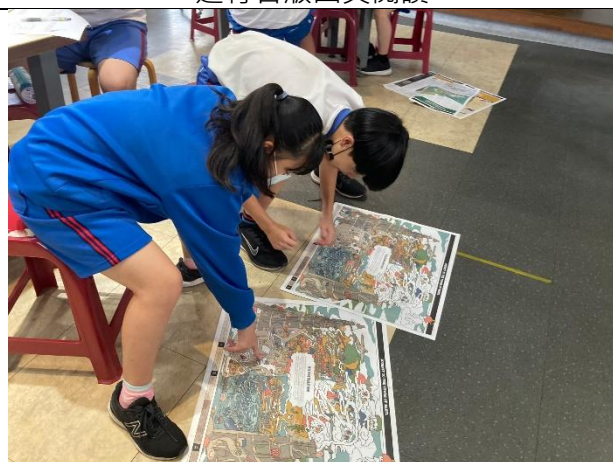
共同合作探索全版迷宮