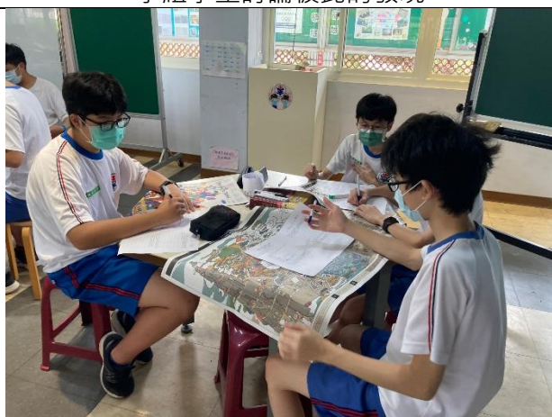
個別書寫自己的發現