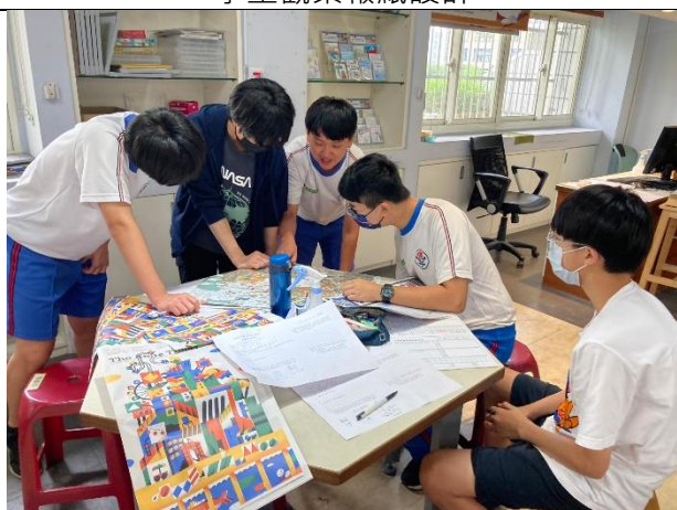
小組學生討論彼此的發現