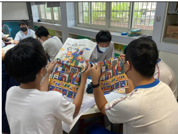
學生觀察報紙設計