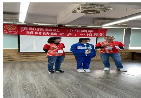
扶輪社贈獎學金，學生回贈感謝卡，學生專注聆聽 Uncle 精彩的短講