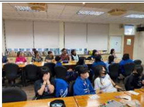
欣賞課程成果影片，學生認真填寫課程回饋單