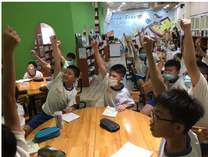
中平國中平日教學即相當注重問與答的互動， 新的學年度期待加入資訊互動的教學成果。