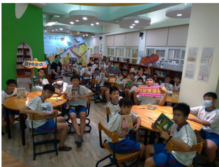
合照完準備去找尋今日想要借的書囉！ 感謝各班國文老師熱情參與！