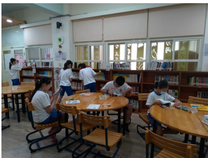
迫不及待開始閱讀！