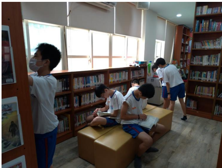
哪本書即將雀屏中選呢？