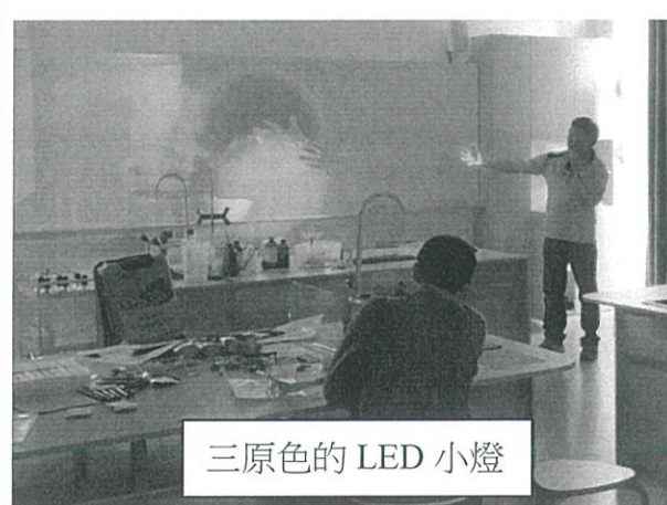
三原色的 LED 小燈